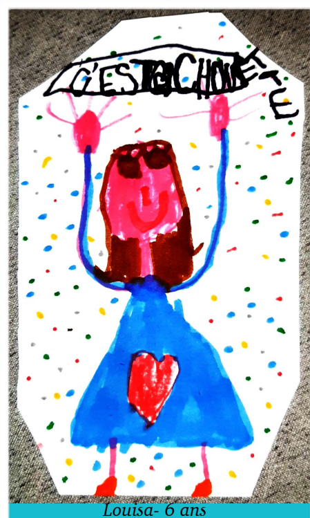
Louisa- 6 ans

Pour participer à la Transition Educative , partagez vos réalisations constructives. Pensez à les identifier !